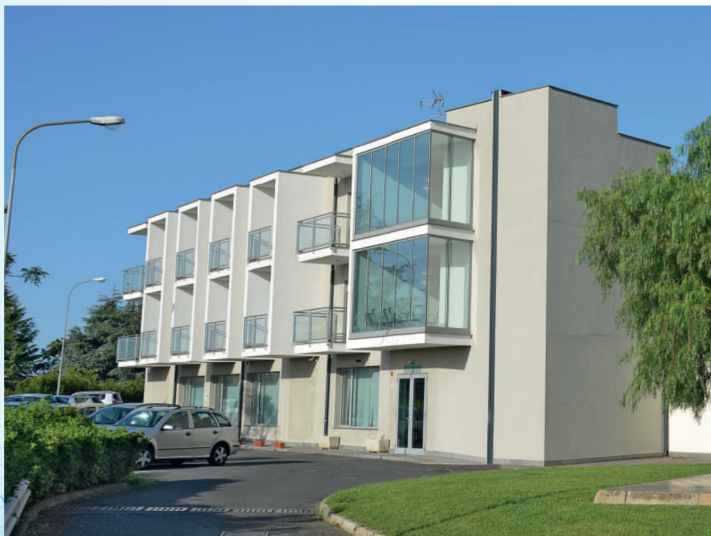
Polo di Riabilitazione locomotoria