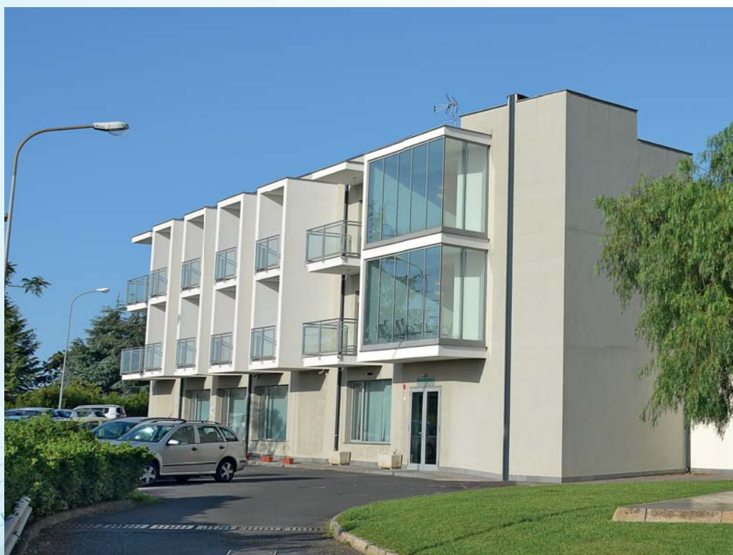
Polo di Riabilitazione

La sua opera più celebre è il libro in 5 volumi "De sedibus et causis morborum per anatomen indagatis". Gran merito scientifico del Morgagni fu propugnare il metodo della osservazione anatomica per giustificare il sintomo, nel tempo in cui dominavano in medicina concetti astratti, più filosofici-metafisici, che anatomo patologici.